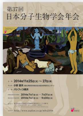
第37回 年会ポスター 元絵 ポール・ゴーガン作 「我々はどこから来たのか、我々は何者なのか、我々はどこへ行くのか」