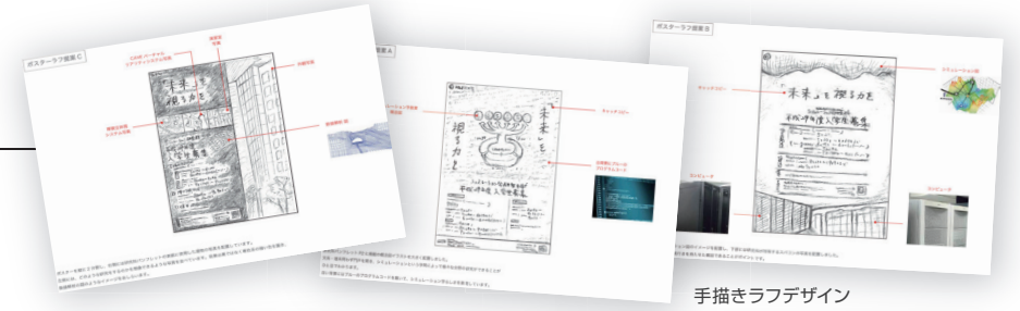
手描きラフデザイン