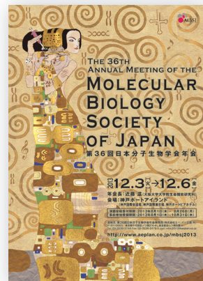
第36回年会ポスター 元絵 グスタフ・クリムト作 「ストックレー・フリーズ『期待』」

名画をベースにすることで通りかかると人の目を引き、近くで見ると生命科学のエッセンスが描き加えられていることがわかる、研究者の方に「おっ!」と思っただけのポスターになりました。