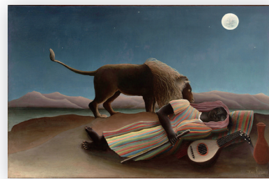
元絵 「眠るジブシー女」

これまで日本の学会告知ポスターの多くは、開催地域の建物や風景をモチーフにした一般的なデザインのものでした。