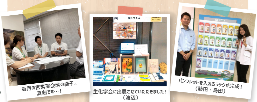
毎月の営業部会議の様子。真剣です...!