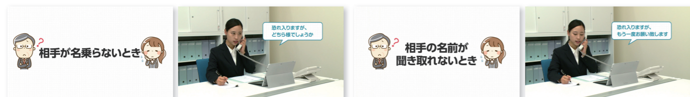
新入社員が陥りがちな困ったシチュエーションの対処法を、パターン別に細かく撮影