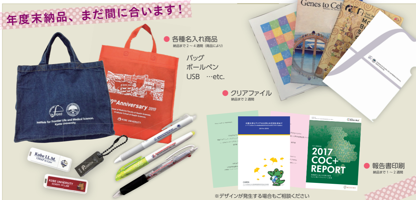
※デザインが発生する場合もご相談ください