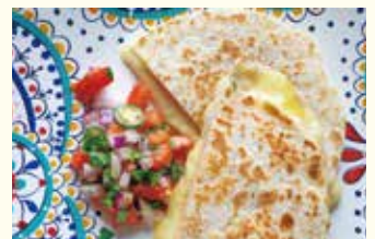
アスタ ラ フロキシマ