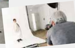
プロのモデルさんみたい!