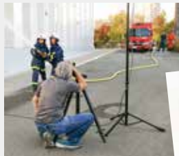
迫力のある放水シーンが撮影できました!

モデルのお二人は実際に消防団員として活動している学生さん。何度もテイクを重ね頑張ってくださいました。神戸市のためにこれからも頑張ってください!