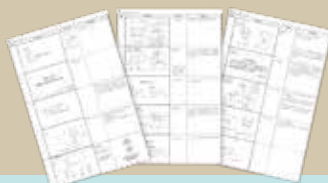
◀撮影の詳細が確認できる絵コンテ

完成した映像をご確認いただき、必要に応じて調整を行います。納品はデータ共有(オンライン)やDVDなど、ご希望の形式に対応可能です。安心してご利用いただけるよう、最後まで丁寧にサポートいたします。